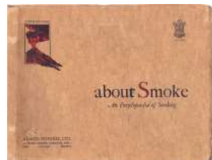
About Smoke (5 th Edition), 1924

Fu a metà degli anni '20, quando l'Art Deco era diventato uno stile di design consolidato, che Alfred Dunhill pubblicò la quinta edizione del suo catalogo di prodotti About Smoke , un'enciclopedia di fumo contenente una varietà di prodotti, sia pipe che accessori, progettati nello stile Art Deco.