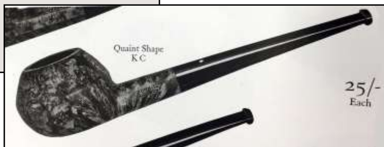
Immagini dall'archivio About Smoke (5 th Edition), 1924

Questa interessante edizione limitata è un set composto da due pipe Quaint. Una forma è stata recentemente riscoperta nella quinta edizione del catalogo di Alfred Dunhill About Smoke - un'enciclopedia del fumo del 1924. L'altra è stata ritrovata nei nostri archivi in fabbrica ed è stata scelta in quanto perfettamente complementare alla prima. Queste forme non vengono realizzate da almeno 30 anni.