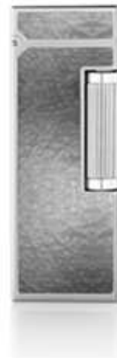
RRR1081030TU ROLLAGAS Hammered Grigio **

** L'effetto martellato si ottiene attraverso una reazione chimica: il metallo viene ricoperto con il colore desiderato e poi immerso in un bagno chimico. Ciò causa un effetto di coagulazione della colorazione e quindi l'effetto martellato.