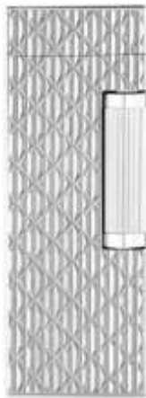
FRR1031056TU ROLLAGAS Modernist Placcato Palladio