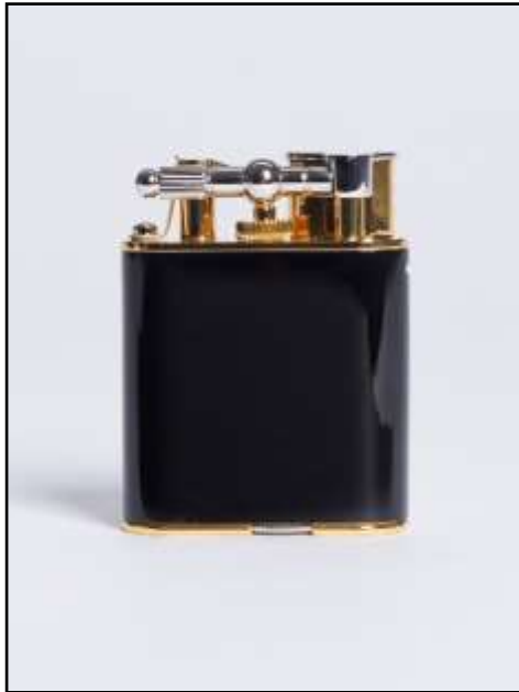
RRTA051001TU UNIQUE TURBO Lacca Nera Placcato Oro e Palladio