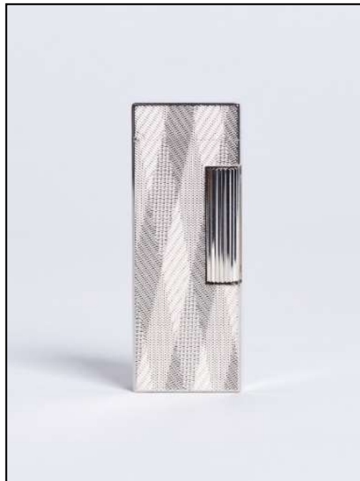
RRR1611054TU ROLLAGAS Beam Placcato Palladio