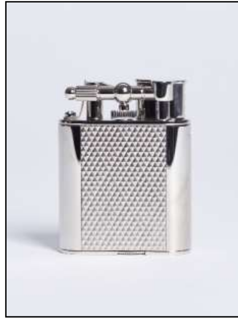
RRT1031040TU UNIQUE TURBO Punta di Diamante Placcato Palladio *

* Nota: i due pannelli laterali del RRT1031040TU Unique Turbo Punta di Diamante Placcato Palladio sono ora finitura spazzolata, non lucidata come mostrato in figura.